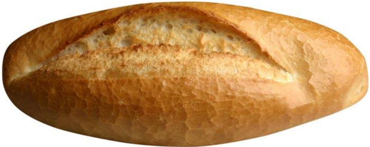
صورة رغيف الخبز التركي