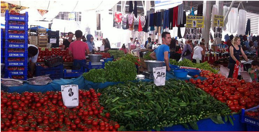
صورة لأحد بازارات إسطنبول داخل الأحياء

www.hal.gov.tr/Sayfalar/Pazar-Yerleri.aspx