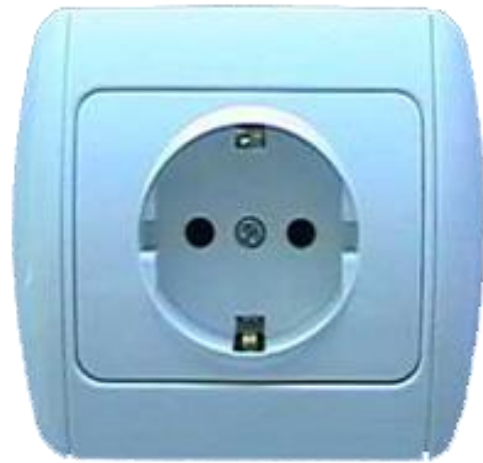
صورة توضح نوعية مقابس وأفياش الكهرباء المعتمدة في تركيا