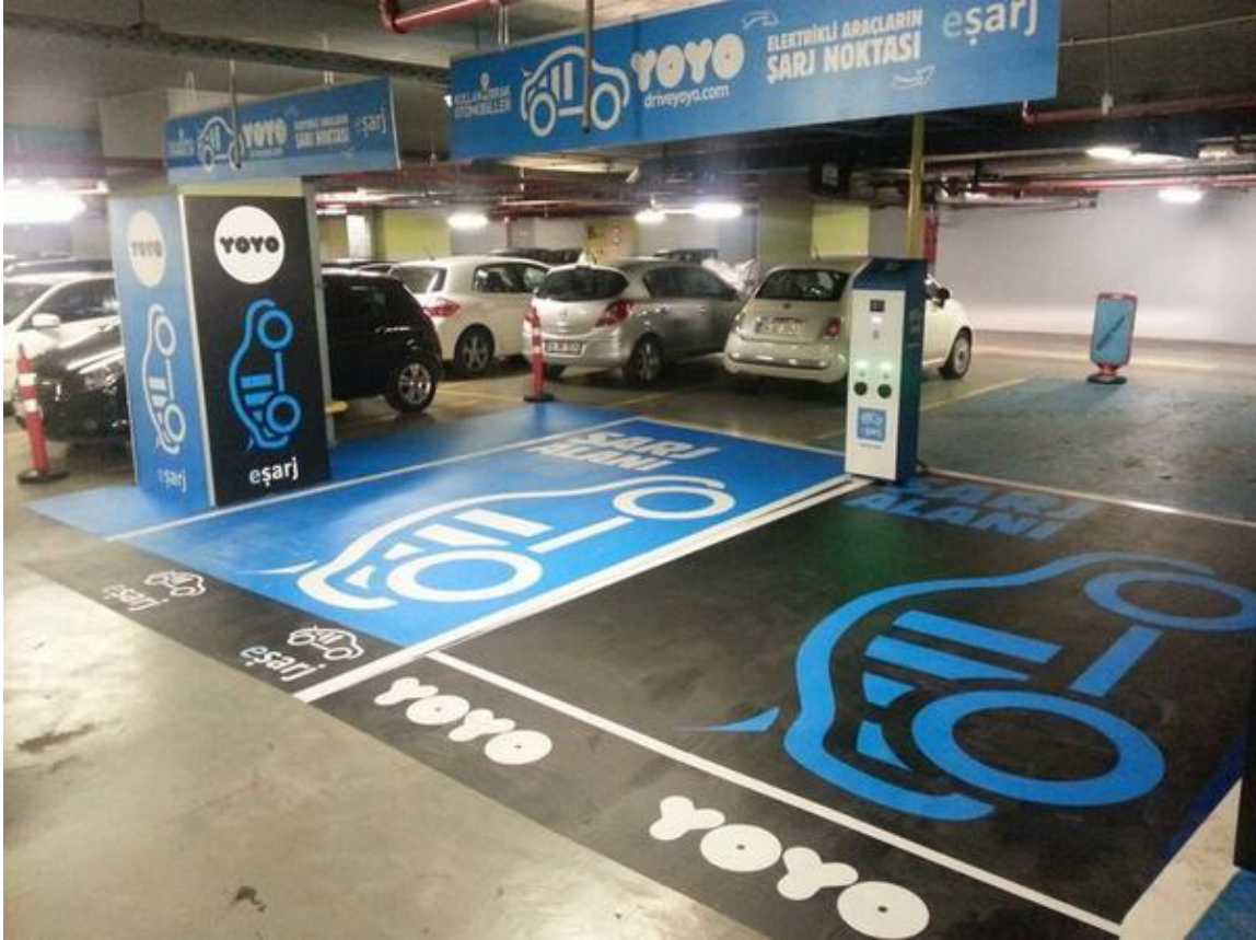
صورة لمنصة الشحن الكهربائية للسيارات في أحد مواقف مولات إسطنبول

المستقبل قادم للسيارات الكهربائية والهجينة ولذا تجد البدء في انتشار محطات الشحن الكهربائي للسيارات في الكثير من الأماكن في تركيا