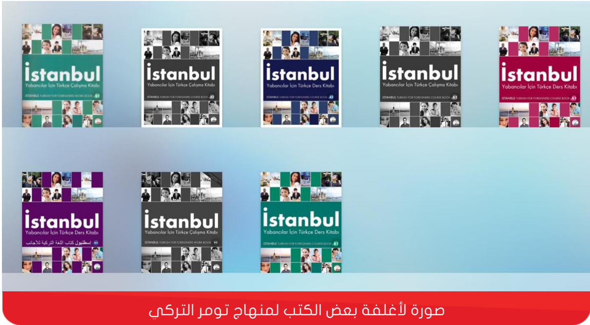
صورة لأغلفة بعض الكتب لمنهاج تومر التركي

يوجد لكل مستوى تعليمي كتاب منفصل ولا يفضل الدراسة منه بدون دورة تدريبية حيث أنه يعد كتاب مساعد كذلك الحال يوجد كتاب عملي لكل مستوى بحيث يتم العمل به